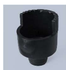
Aplikátory bočního typu pro přesnou aplikaci kapaliny