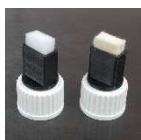
Zakázkové typy aplikátorů dle požadavků zákazníka v různých rozměrech