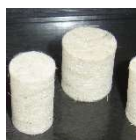
Náhradní filcové tampóny ze 100 % vlny, v průměrech od 8-22 mm