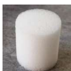
PUR tampóny s vyšší propustností