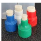
Nejčastěji dodávané závitové aplikátory kruhového typu ve standardních průměrech 8-22 mm

Použití aplikátorů je typické zejména pro automobilový průmysl a stavebnictví, ale uplatnění nacházejí v řadě dalších průmyslových odvětví.