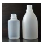
Závitové lahvičky pro kapaliny